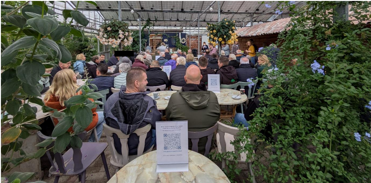
Impressie gezamenlijk deel van de buurtsafari

Bijlage 2; Online reacties van: samenwerkenaan.heerde.nl